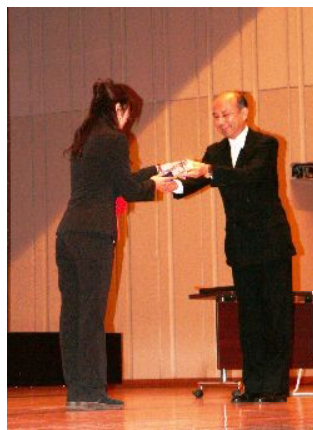
第1回表彰式（キャリア・コンサルタント全国大会にて）

★応募レポートのボリュームを今回から10ページに変更し、応募しやすくしました。（前回は20ページ）